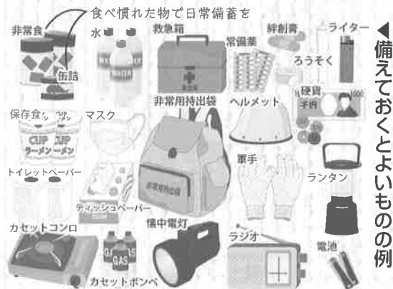
◀備えておくといよいものの例

普段の日常で自分が使っている物を、いつも少し多めに備えておくことを「日常備蓄」といいます。たとえば、普段食べ慣れていない物より、食べ慣れた物を買っておき、賞味期限をみながら順に食べて補充しておくなど、負担にならないことから始めてみてください。