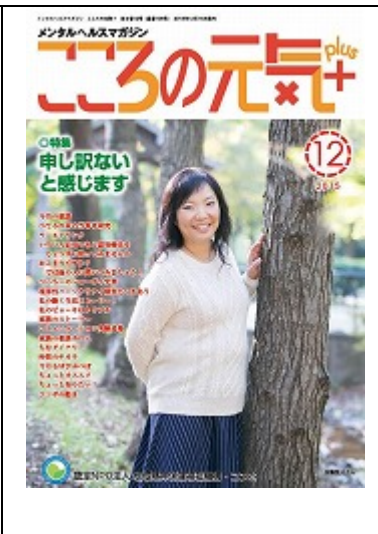
啓発誌「ココロの元気+」12月号