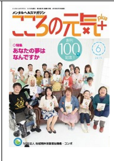
啓発誌「こころの元気+」6月号