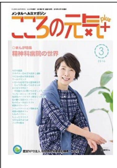
啓発誌「ココロの元気+」3月号