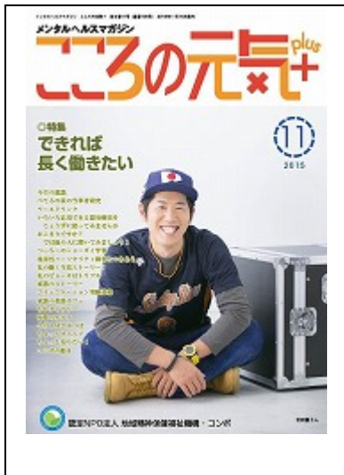
啓発誌「ココロの元気+」11月号