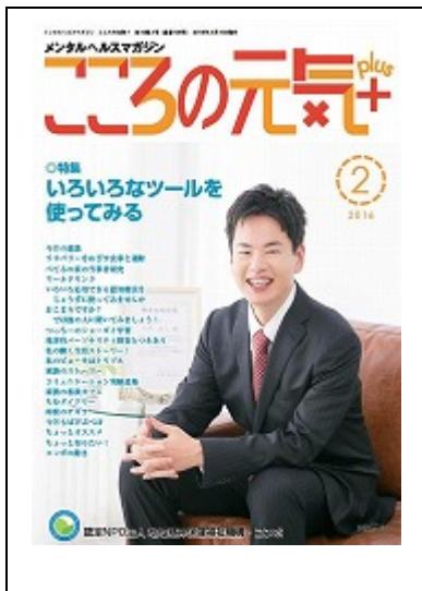
啓発誌「ココロの元気+」2月号