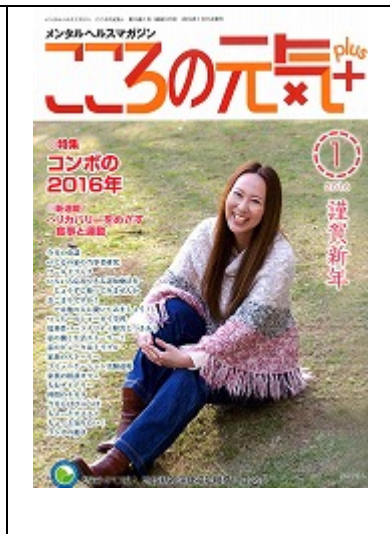
啓発誌「ココロの元気+」1月号