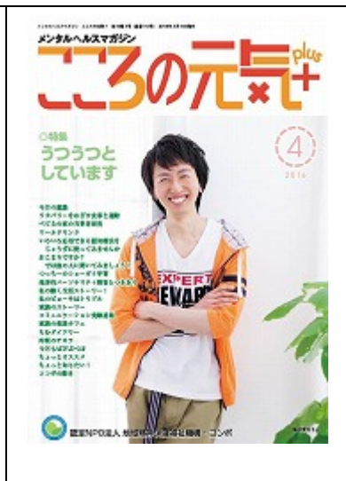
啓発誌「ココロの元気+」4月号