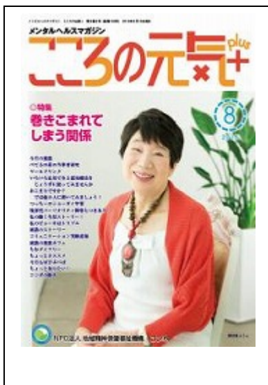
啓発誌「こころの元気+」8月号