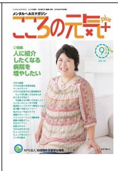
啓発誌「こころの元気+」9月号