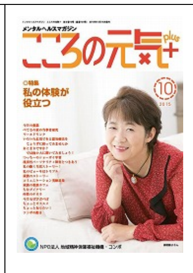
啓発誌「こころの元気+」10月号