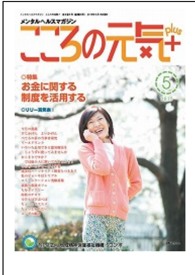
啓発誌「こころの元気+」5月号

1) 啓発冊子「こころの元気+」 毎月10,000部×12回(10,000部/月×12回/年)