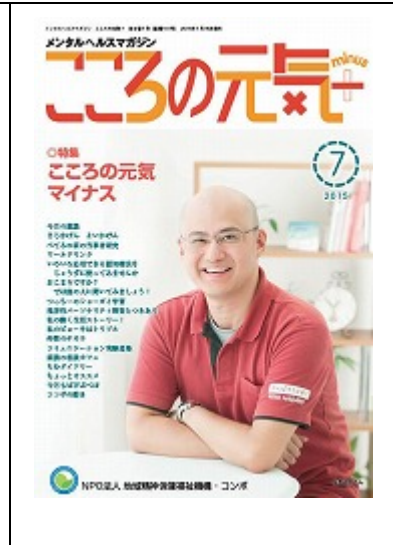
啓発誌「こころの元気+」7月号