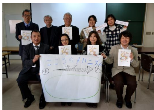
「親が元気になると子どもにもよい影響がある」と話す「こころ・あんしん Light」カンガルー部会の方々

「同じ悩みを抱える親がいるはず」と、2008 年 5 月より児童・思春期にこころの不調、病気を発症した子どもの家族会を開催。2009 年 2 月、「こころ・あんしん Light」（通称：こあら）を設立し、就学期の子どもを持つ親同士が悩みを分かち合い、情報交換できる場を目的に家族会を運営している（2011 年 4 月 NPO 法人格取得）。「やっとな話せる」と相談の電話は 1 時間に及ぶこともある。また、親や教育、福祉、保健医療の関係者らによる「支援者会」の活動も実施。学校や地域の理解が不可欠と講演会や市民講座、教員研修、専門職養成大学での講義などの啓発活動を行っている。