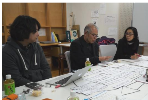
養護教諭の研究会や、高校でパイロット授業を行い、そこで出た意見も取り入れながら教材を完成させた

2012 年、外部の支援者にも呼びかけ「カンガルー部会」を結成。こころの不調を学ぶ生徒向け教材『はーとトンネル』を 3 年がかりで作成した。当事者である子どもたちの意見をもとに、養護教諭や教員の意見も取り入れながらまとめた。疾患説明が中心ではなく、どんな言葉がうれしかったか、どんな場面が辛かったか、「不調になっても変わらずに接してほしい」「声をかけてほしい」など、友達や教員の関わり方に焦点を絞らした。教材 DVD でインタビューに参加した当事者は、自分の経験を今の生徒に伝えていけることが、とても力になっているという。